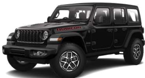
1 ブラック C/C