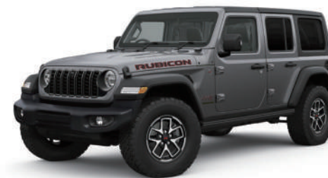
5 グラナイトクリスタルメタリック C/C