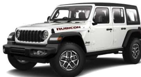
2 ブライトホワイト C/C