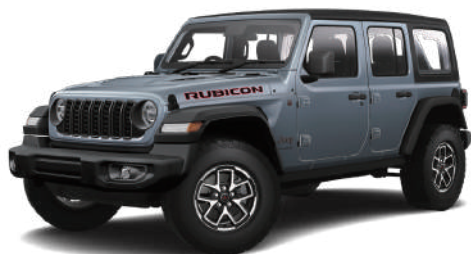
3 アンヴィル C/C