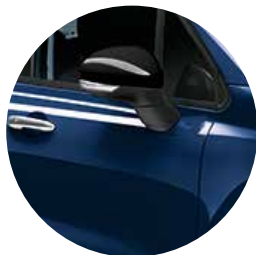
888 ベネツィア ブルー