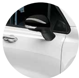
296 ジェラート ホワイト