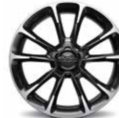
18インチ 10スポーク アルミホイール