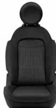
ブラック(ファブリックシート)