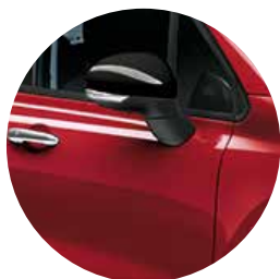
289 パッション レッド *500X Clubのみ