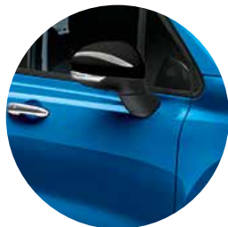
018 イタリア ブルー