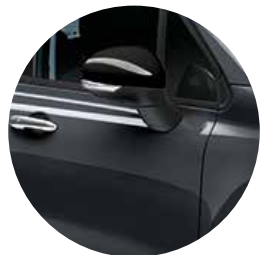
679 ファッション グレー