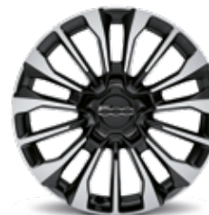
17インチ 15スポーク アルミホイール