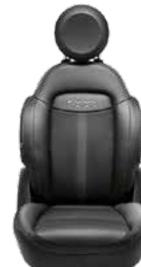
ブラック(スポーツシート)