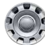
14インチ スチールホイール +ホイールカバー