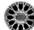
16インチ ダイヤモンドカット アルミホイール