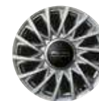
15インチ 14スポーク アルミホイール