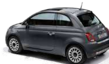
695 ポンペイ グレー