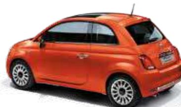
562 シチリア オレンジ