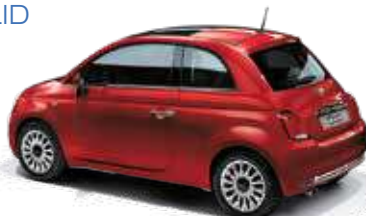
111 パンドブレ レッド