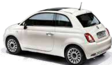
268 ボサノバ ホワイト