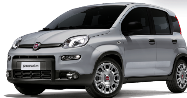
785 モード グレー