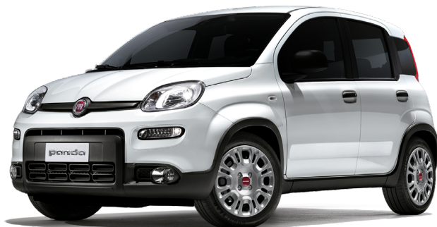
296 アイス ホワイト