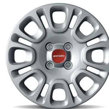
14 インチ スチールホイール