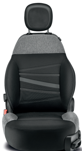
139 グレー / グレー