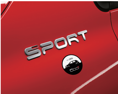
● SPORT+ 専用オリジナルバッジ