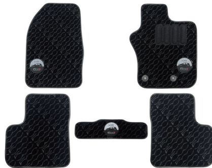
● SPORT+ 専用オリジナルプレミアムフロアマット (フロント/リア)