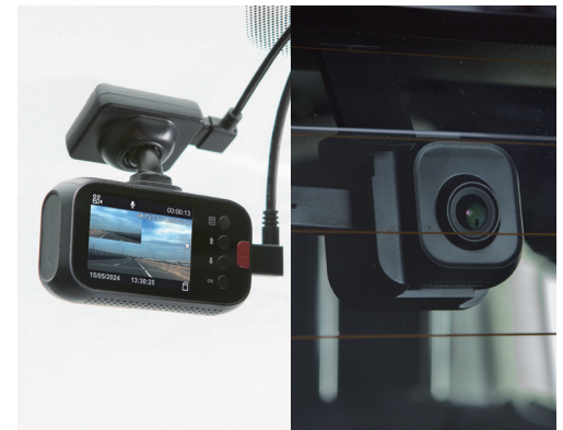
● FIAT 純正ドライブレコーダー V263A (フロント+リアセット)