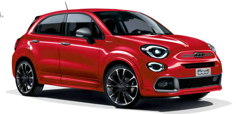
ボディカラー：パッション レッド

コンパクトSUVならではの楽しさをたっぷり詰め込んだ『500X SPORT+』と、遊びを、お出かけを、ドライブを、もっともっと楽しもう!