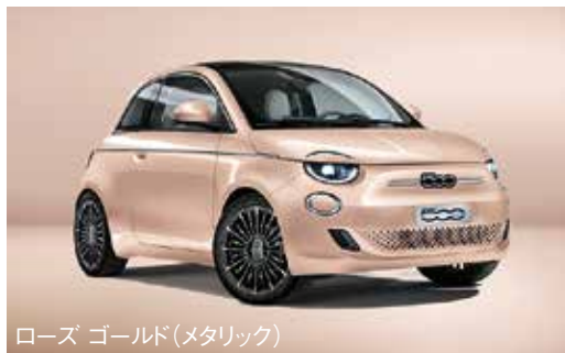
ローズ ゴールド(メタリック)