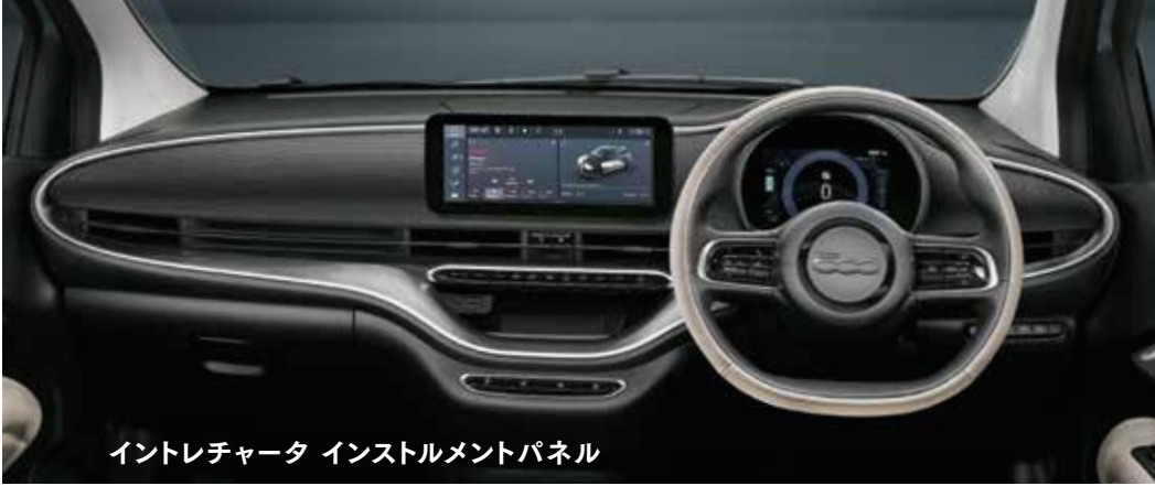
イントレチャータ インストルメントパネル