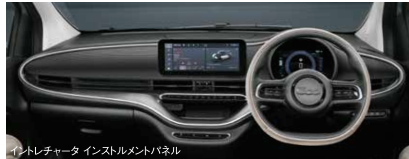
イントレチャータ インストルメントパネル