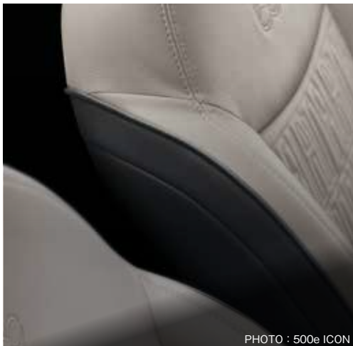
PHOTO : 500e ICON