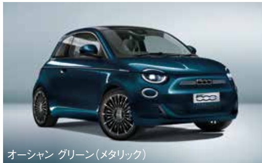
オーシャン グリーン(メタリック)