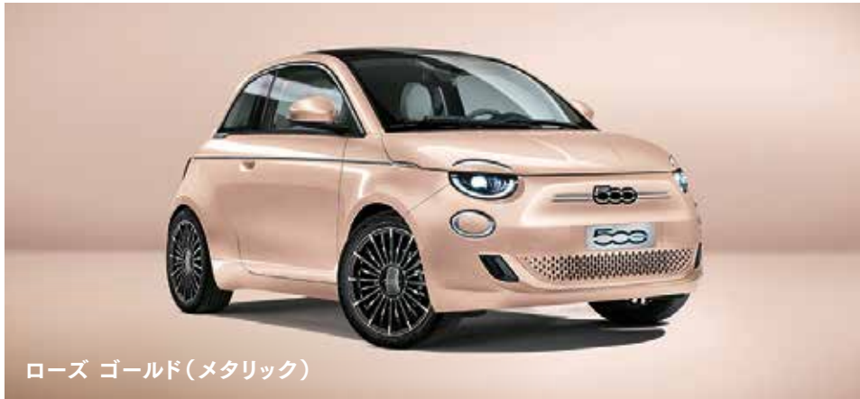
ローズ ゴールド(メタリック)