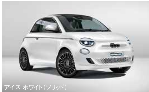
アイス ホワイト(ソリッド)