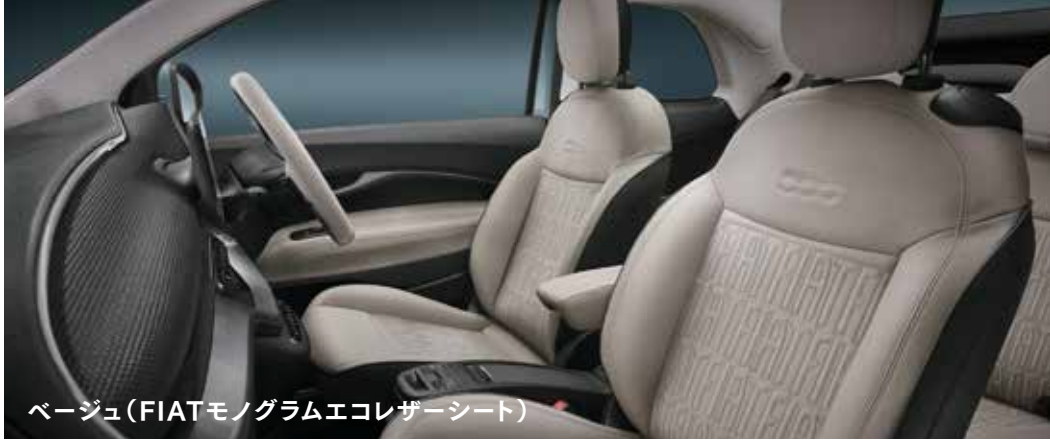
ベージュ(FIATモノグラムエコレザーシート)