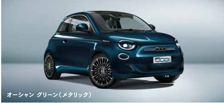
オーシャン グリーン(メタリック)