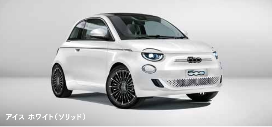
アイス ホワイト(ソリッド)