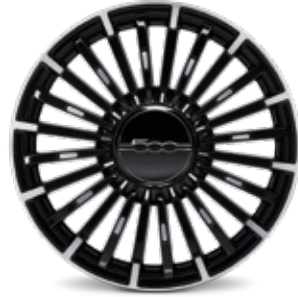
17インチ ダイヤモンドカット アルミホイール