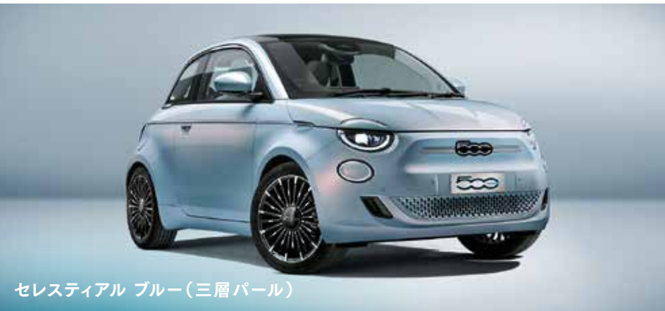
セレスティアル ブルー(三層パール)