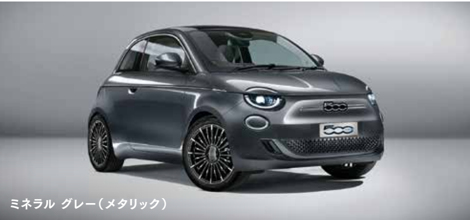
ミネラル グレー(メタリック)