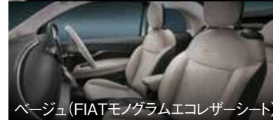
ページュ (FIATモノグラムエコレザーシート)