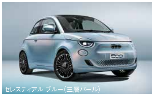
セレスティアル ブルー(三層パール)