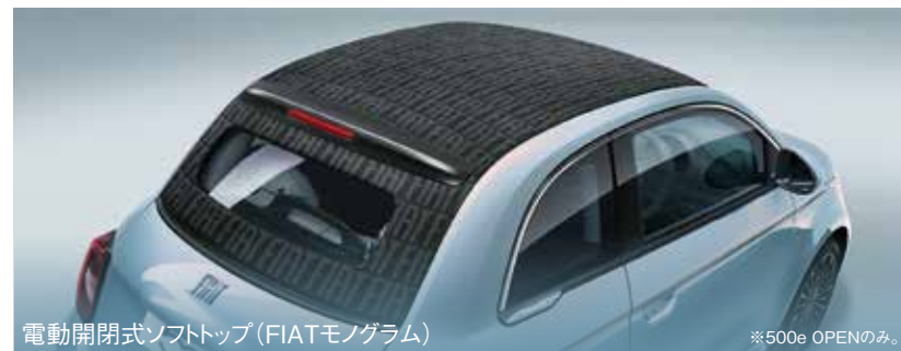
電動開閉式ソフトトップ (FIATモノグラム)