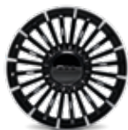
17インチ ダイヤモンドカット アルミホイール