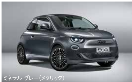
ミネラル グレー(メタリック)