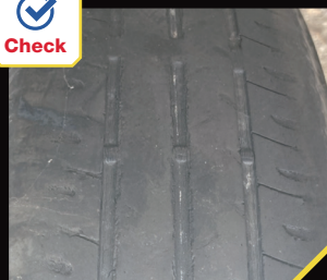
トレッド面の一部がツルツルな状態(偏摩耗)