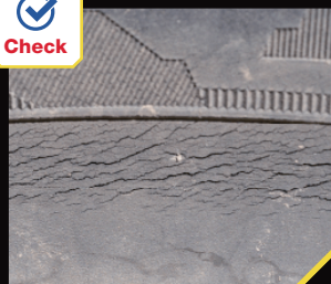
サイドウォール部分にひび割れや擦り傷