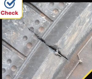
トレッド面、サイドウォール部分などに切り傷